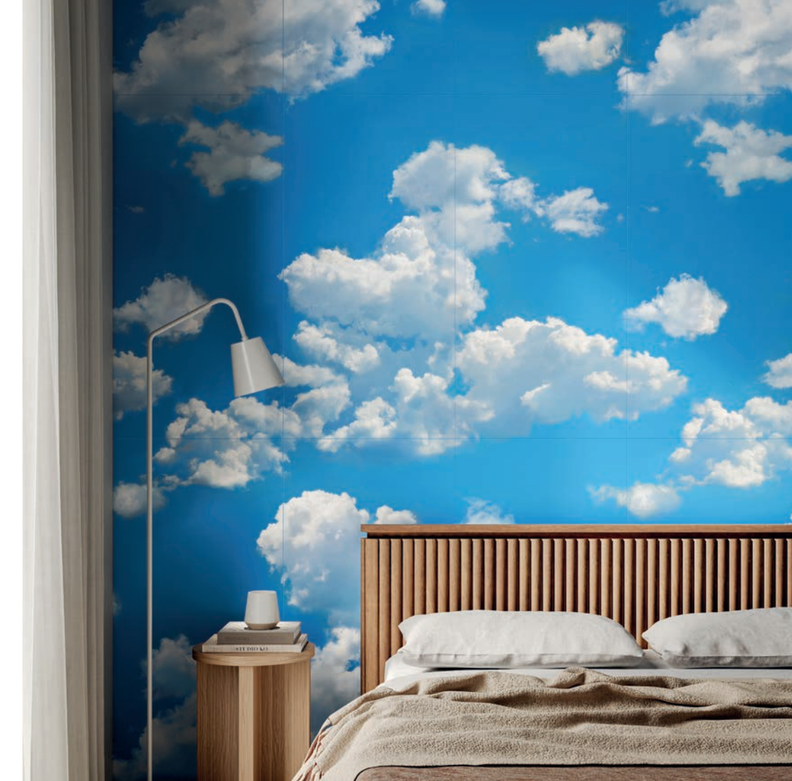
Flow 50x100 cm Rect - 19 1 / 2 "x39"

Fresh and reinvigorating atmospheres that radiate positivity