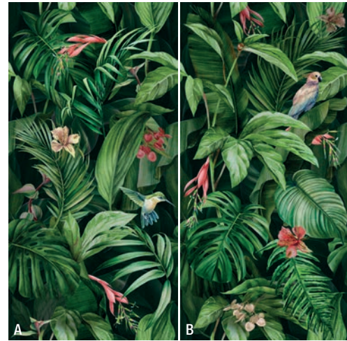
VISION 2 moduli_2 modules_A+B