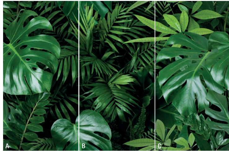
JUNGLE 3 moduli_3 modules_A+B+C