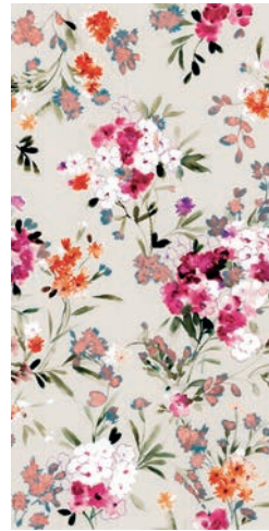
BOUQUET 1 modulo_1 module