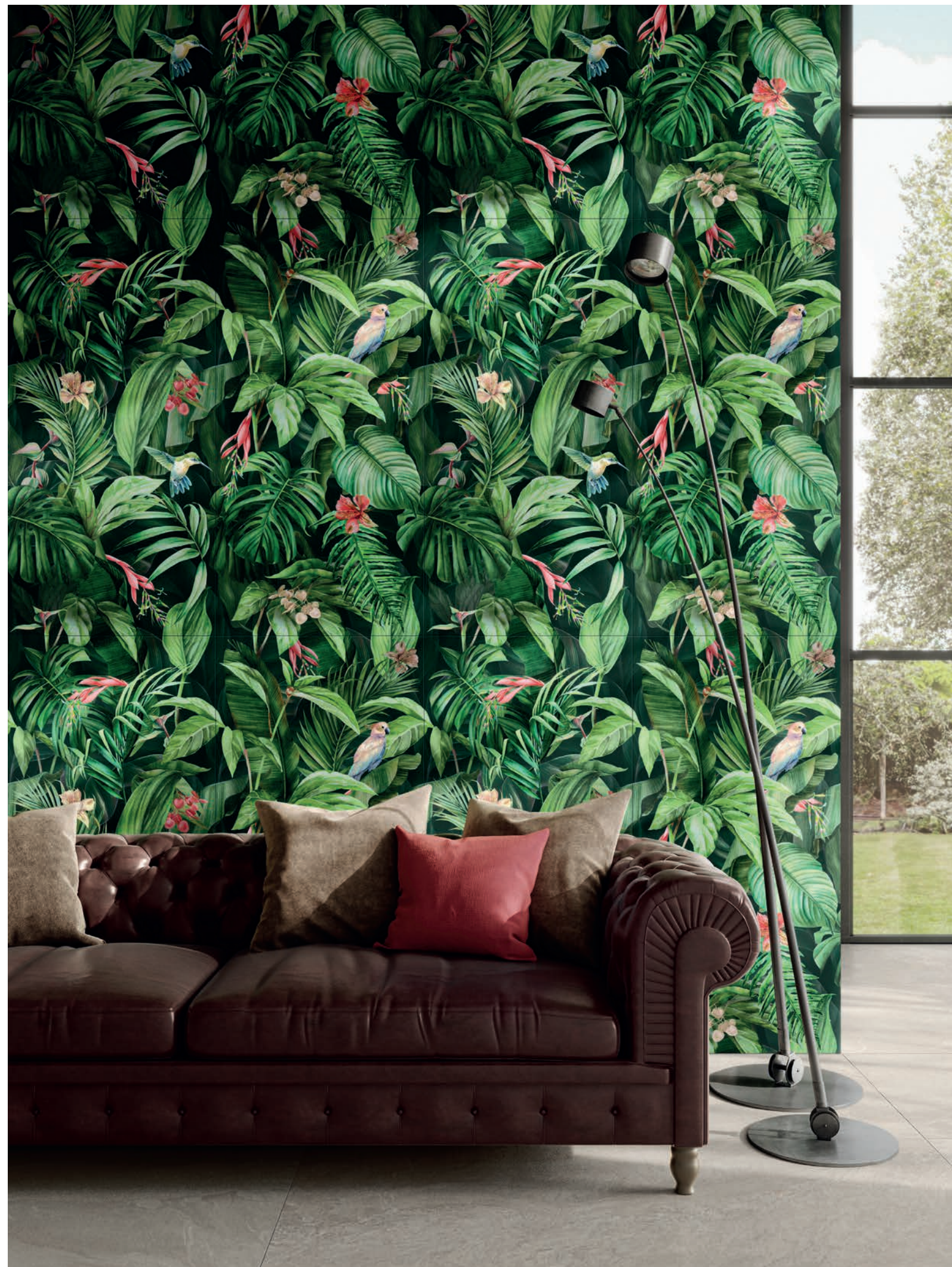
Vision 50x100 cm Rect - 19 1 / 2 "x39"