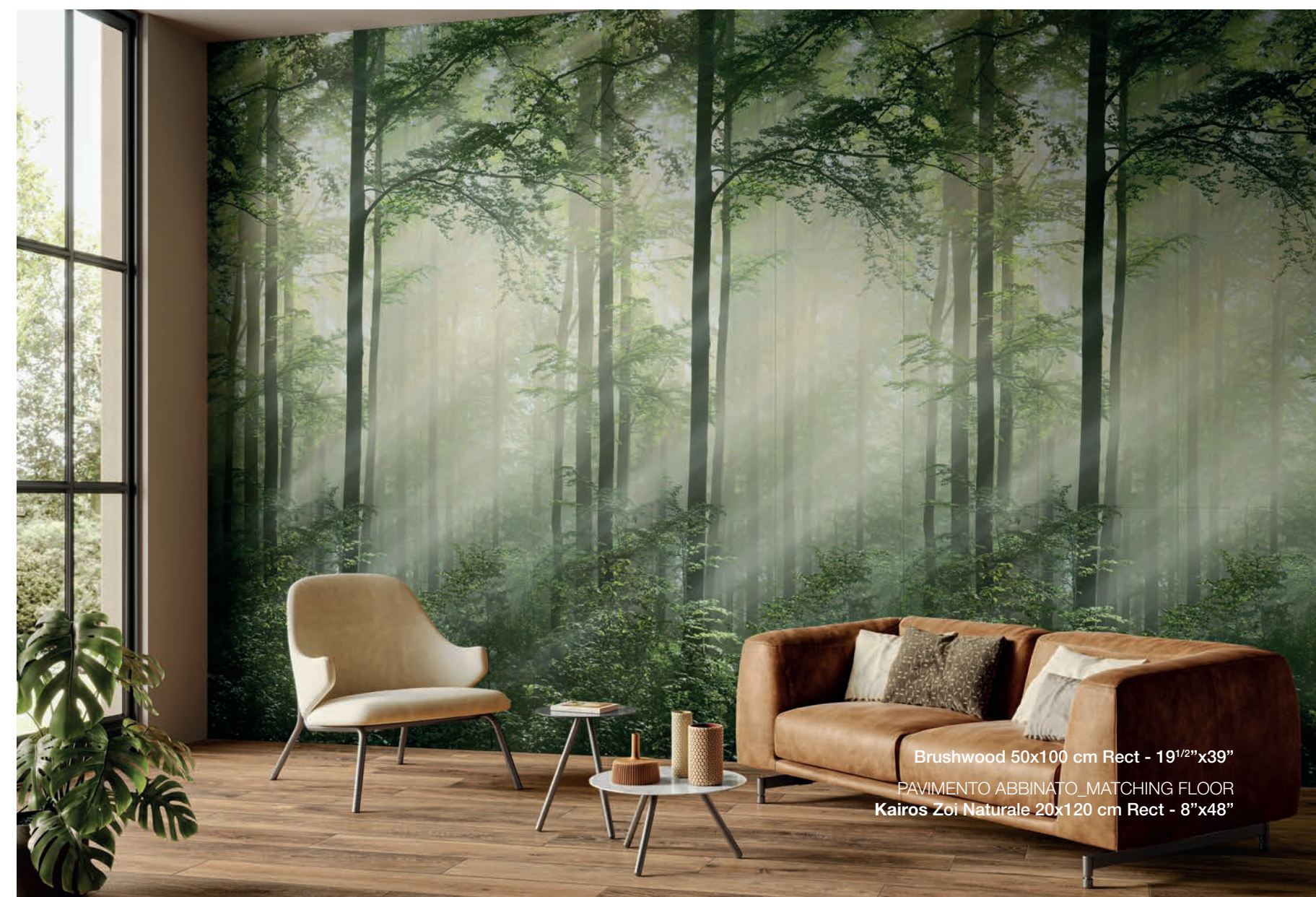
Brushwood 50x100 cm Rect - 19 1 / 2 "x39"