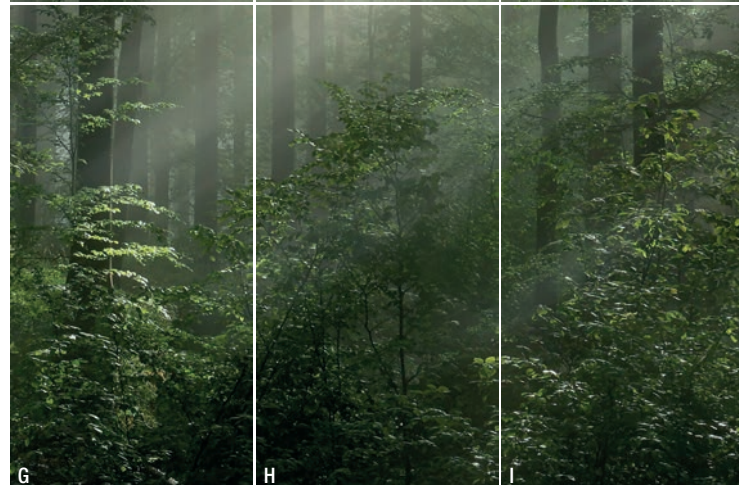
BRUSHWOOD 9 moduli_9 modules_A+B+C+D+E+F+G+H+I

LA LASTRA CERAMICA PIÙ SOTTILE AL MONDO THE THINNEST CERAMIC SLABS IN THE WORLD